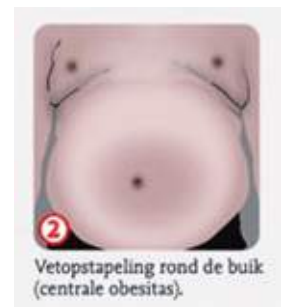
Afbeelding uit de Infographic over het syndroom van Cushing.

Na genezing van het syndroom van Cushing kunnen de bijkomende ziekten blijven bestaan en soms is het noodzakelijk deze te blijven behandelen. Dagelijks slikken van medicatie en aandacht blijven besteden aan lichaamsbeweging kost veel inzet van de (ex)patiënt, maar betaalt zich uiteindelijk uit in minder complicaties op lange termijn.